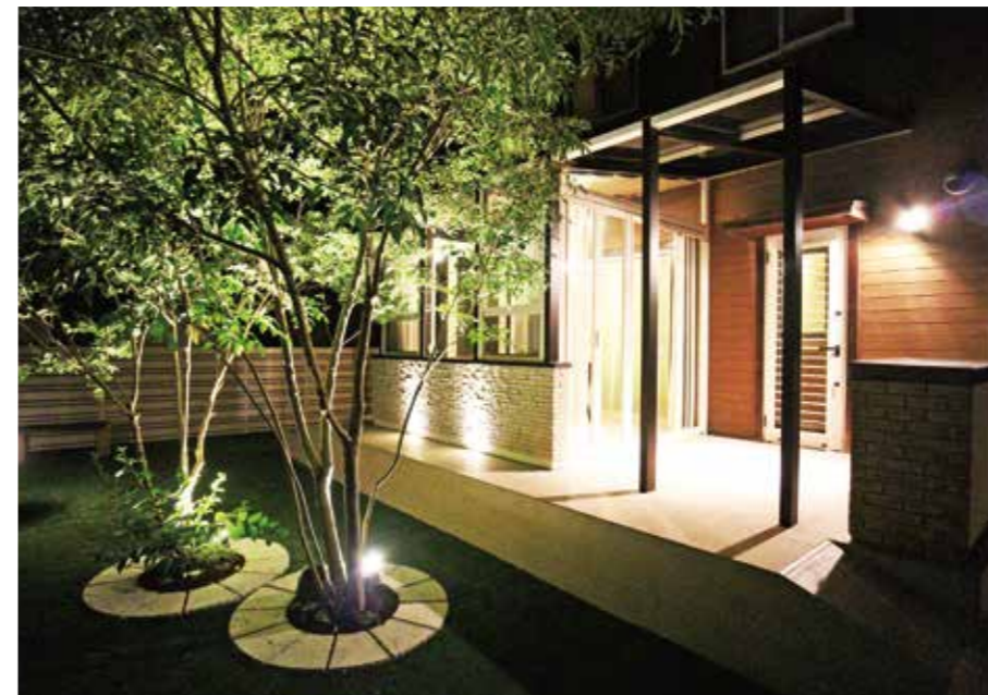
●ローボルト(12V/24V)ライトをご使用の際にはローボルトトランス、ジャンクションボックス、専用コード等のアクセサリが必要となります。