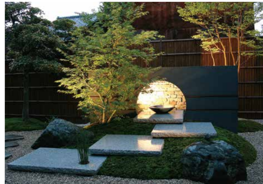
●ローボルト(12V/24V)ライトをご使用の際にはローボルトトランス、ジャンクションボックス、専用コード等のアクセサリが必要となります。